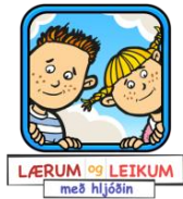
Lærum og Leikum

Hér kemur listi yfir 15 algengustu smáforritin sem notuð eru í íslenskum leikskólum.