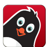
Georg og félagar