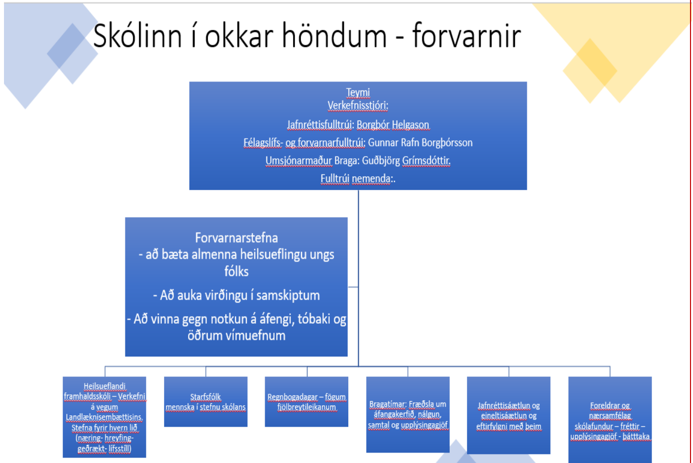
Mynd 1. Skólinn í okkar höndum

Markmið Skólans í okkar höndum er heildstæð forvörn líkamlegrar, andlegrar og félagslegrar heilsu – til eflingar lærdómssamfélagsi FSu. Til að ná markmiðinu er fléttað saman fræðslu og aðgerðum gegn einelti, leiðum að enn betri skólabrag, dagamun og heilsuefandi framhaldsskóla. Allir sem koma að starfi FSu eru þátttakendur í verkefninu: Nemendur, kennarar, starfsfólk, stjórnendur, foreldrar og yfirvöld. Skólinn í okkar höndum var stofnað upp úr Ölveus eineltisáætluninni. Á fyrstu tveim önnum sínum í skólanum taka allir nemendur áfanga í félagsfræði og umhverfisfræði. Þar er lögð áhersla á Heimsmarkmið Sameinuðu þjóðanna um sjálfbæra þróun og grunnþætti menntunar sem skilgreindir eru í aðalnámskrá framhaldsskóla og öllum skólum ber að leggja áherslu á. Í ársskýrslu skólans er gert grein fyrir þeim verkefnum sem unnin hafa verið undir hatti Skólinn í okkar höndum – forvarnir.